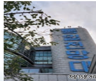
차량 35분 거리

한강 상류에서 흘러 내려오는 임진강이 만나는 곳으로 해발 118m의 오두산 정상에 있습니다