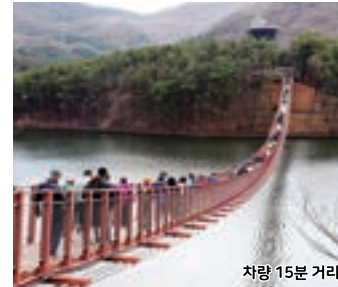
차량 15분 거리